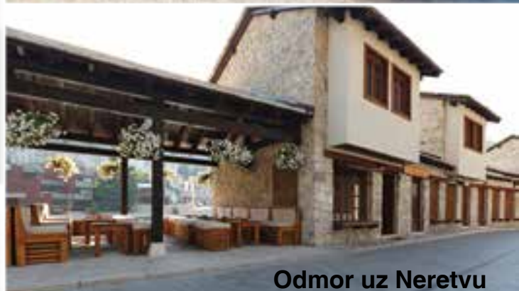
Odmor uz Neretvu