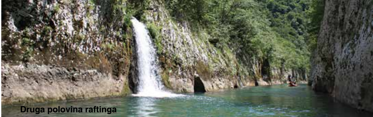
Druga polovina raftinga