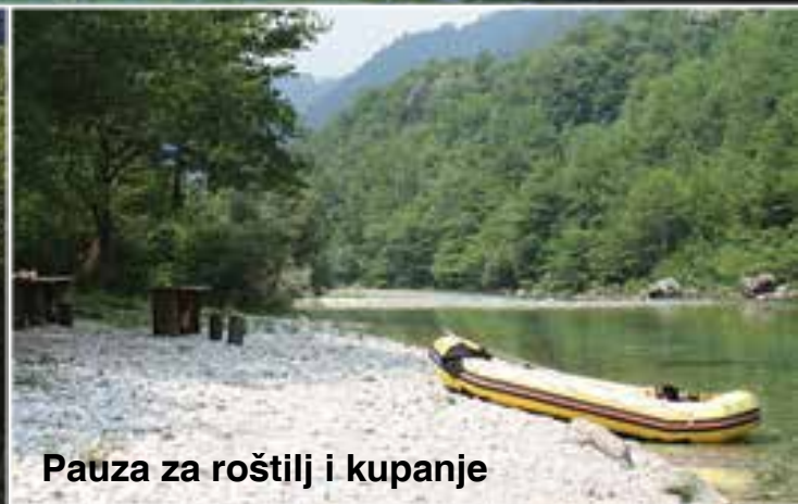
Pauza za roštilj i kupanje