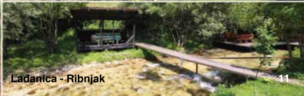
Lađanica - Ribnjak