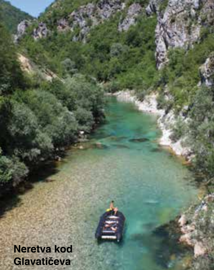
Neretva kod Glavatičeva