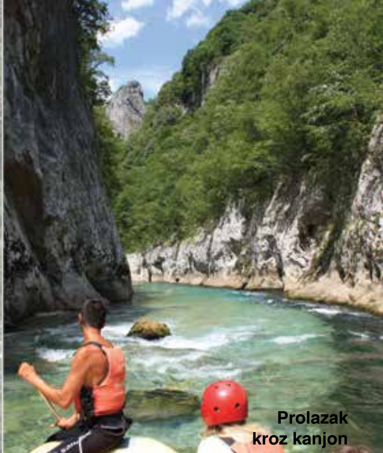
Prolazak kroz kanjon