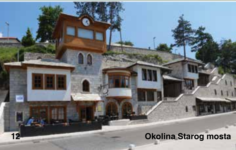
Okolina Starog mosta